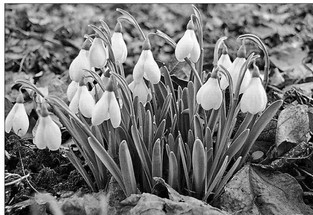
Тендітні первоцвіти потребують захисту