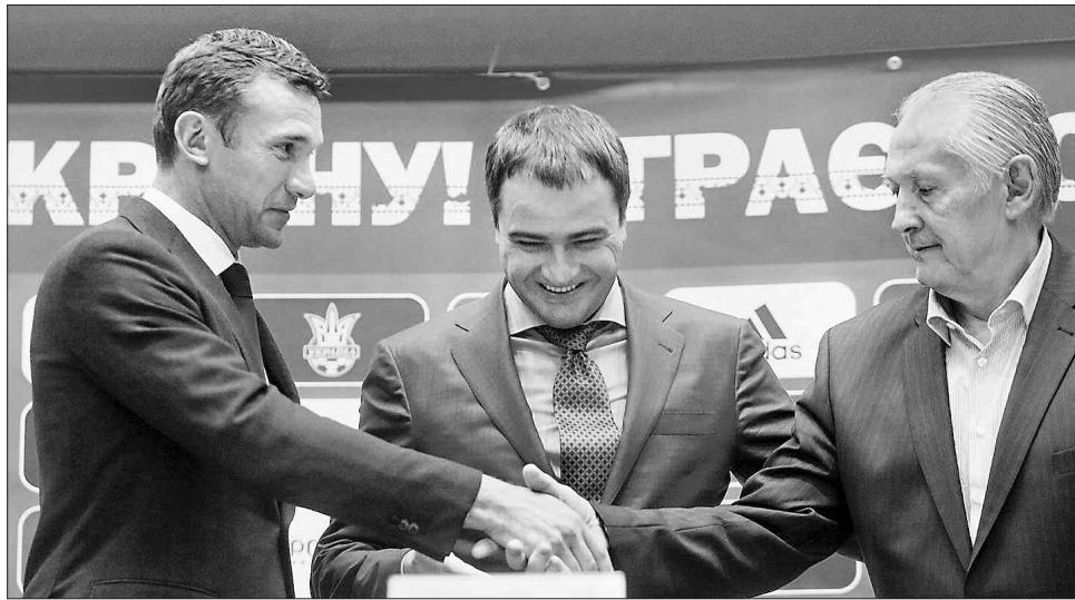
Штаб і команда обіцяють не підвести

«Це велика честь і дуже серйозна відповідальність. Повертаюсь у великий футбол у ролі тренера після чотирьох років відпустки. Намагатимуся виправдати довіру. Працював із такими досвідченими спеціалістами, як Валерій Лобановський, Кар-