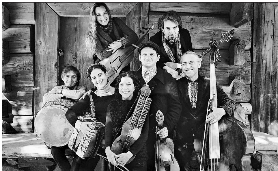
Львівські музики знаходять натхнення у творчості унікальних етносів

«Бурдон фольк-банд» створений 2002 року у Львові. Репертуар гурту побудований на традиційних українських мелодіях, ритуальних піснях, давніх баладах та танцях. Багато пісень взято з локальної традиції унікальних етнічних груп, котрі живуть на теренах карпатського регіону: лемки, бойки та гуцули. Джерела його інспірації знаходяться на