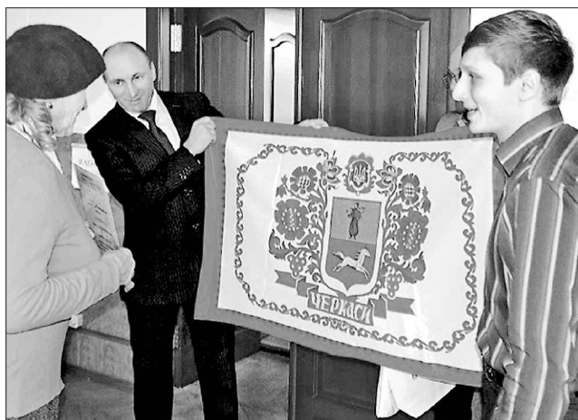
Прапор міста — велика відзнака для кожного учасника конкурсу

У конкурсі беруть участь сотні городян незалежно від того, мешкають вони в приватному домоволодінні чи багатоквартирному будинку. На багатьох квартирах з'явилися таблички із заохочувальними написами. Подвір'я з клумбами, сквери, які оздобили вигадливі господарі, кличуть відпочити в тіні виноградної лози, помилуватися декоративним тином із глечиками в національному стилі, журавлем, що виглядає з гнізда. Кожен шукає власне особливе вирішення, яке б не тільки органічно вписувалося в навколишнє середовище, а й відповідало прагненням та уподобанням сусідів.