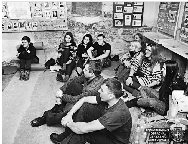
Для патріотичного виховання усі заходи прийнятні

З речей СУМівці могли взяти із собою лише спальник, килимок, молитовник і свічку. Не мали права користуватися жодними засобами зв'язку, ноутбуками, годинниками. Мета заходу, як стверджують ініціатори, полягає не в тому, щоб молодь пережила те, що за комуністичних часів творилося в цих камерах КДБ, а радше проявила внутрішню зосередженість, могла осмислити жертовність, велике прагнення патріотів, безкомпромісну їхню боротьбу за волю України.