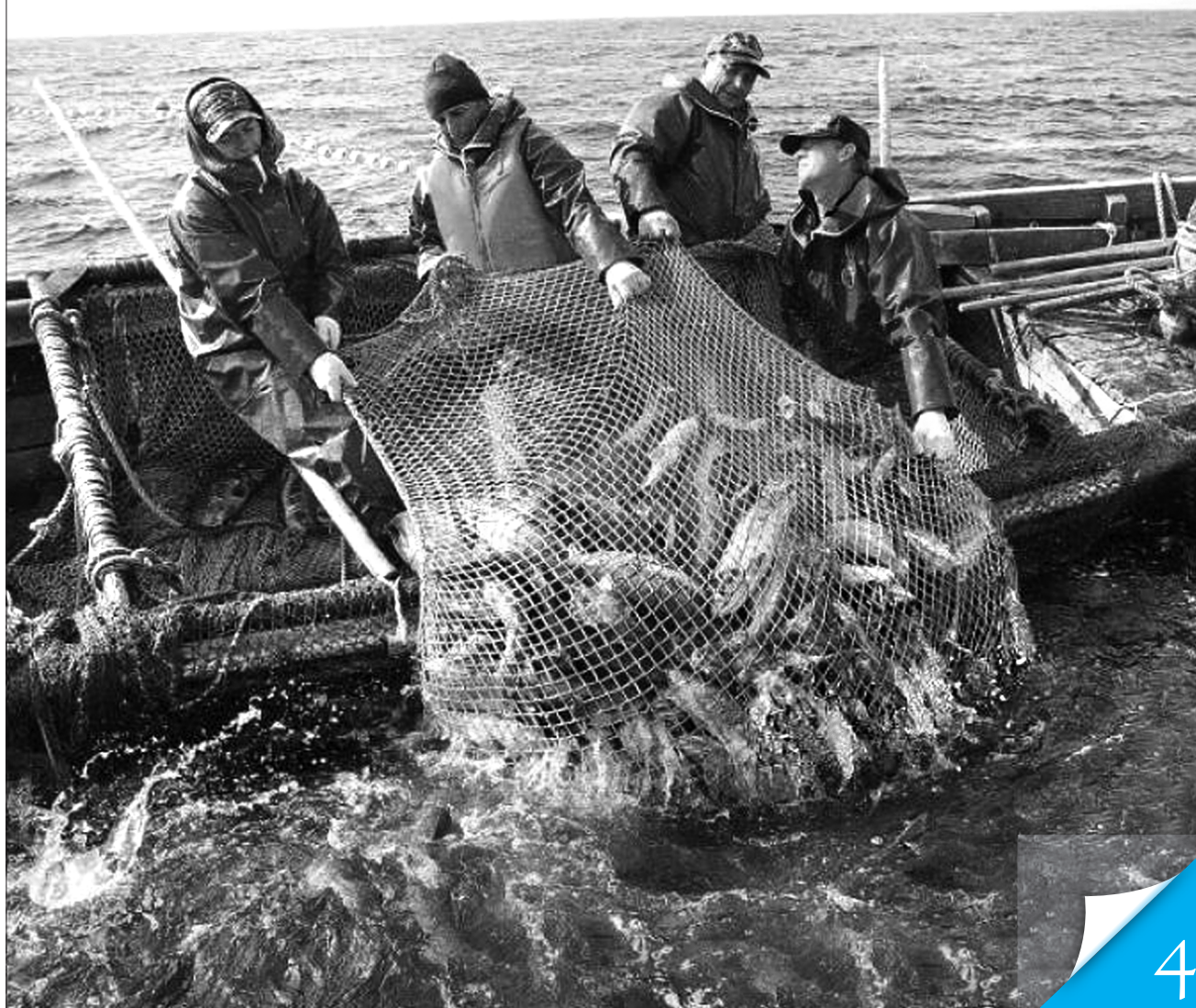
Менше нервів на паперову тяганину – більше часу для справжньої роботи

НА ЧАСІ. Набрал чинності новий порядок спеціального використання водних біоресурсів