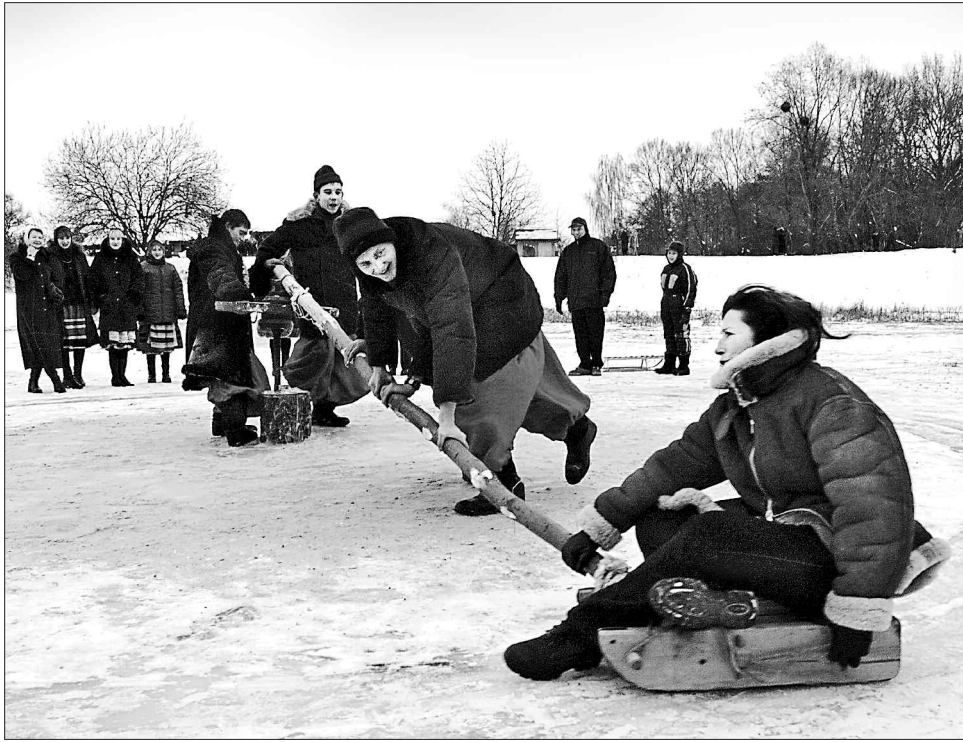
Сезонні розваги на льоду зазвичай сприяли знайомствам, і закохані встигали заручитися ще до Великоднього посту

Цьогорічна Водохреща повною мірою продемонструвала притаманні цьому святу прадавні традиції — морози та хуртовини. Постраждали від небувалих снігопадів Україна, Америка, Європа, Китай... Та відоме прислів'я стверджує: «Тріщи не тріщи, а вже минули Водохрещі». Отже, за народними прикметами, після цього свята зима починає поступово здавати свої позиції. Довшають дні, вище і вище піднімається сонечко, відчутнішим стає тепло його променів. «Лютий зиму проводжає, а весну стрічає», — кажуть старі люди. Швидкоплинню збігає цей найкоротший місяць року. Але свою назву встигає іноді виправдати і пекучим морозом, і заметілями. Наприклад, на Тимофія-Півзимника (4) морози можуть неабияк змінити показники січної температури на пониження. «На Тимофія півзими минає, а мороз забирає», — каже народна мудрість. Цього дня пасічникам слід здійснити контрольну перевірку вуликів. Якщо бджоли гудуть ледь чуто — переносять зиму легко, а неспокійне гудіння застерігає: у вулику якісь негаразди. Яскраве полуденне сонце на Тимофія віщує ранню весну. Якщо погода цього дня вітряна — накликає снігопад на весь наступний тиждень.