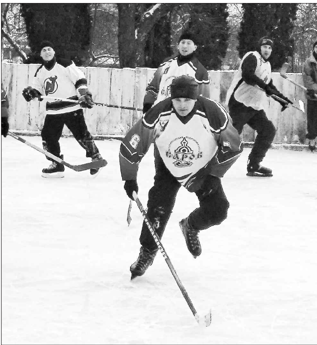
Хокейні баталії в Сварковому стануть регулярними

Як зазначив тимчасовий виконувач обов'язків голови Глухівської районної державної адміністрації Володи-