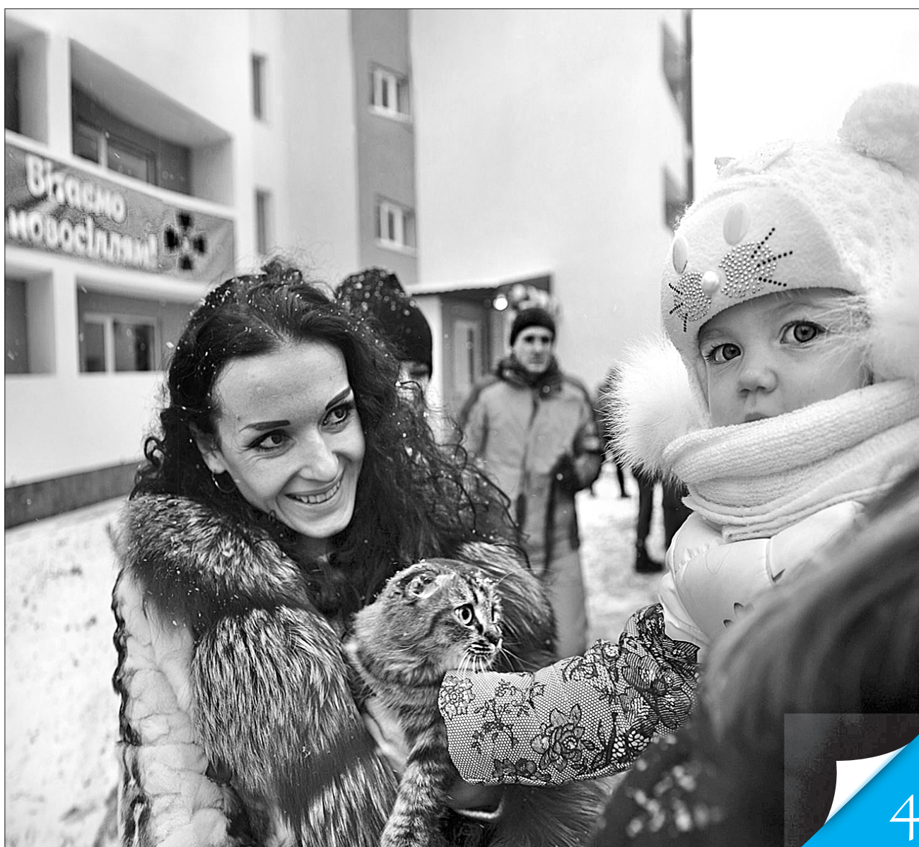
Родини наших воїнів повинні відчувати захист і чоловіків, і влади

НА ЧАСІ. У Львові розпочинається зведення житлового будинку для учасників АТО та сімей загиблих воїнів