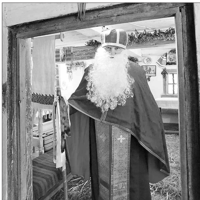
Благодійник-Миколай уже двері відчинив...

Третя Пречиста починає низку зимових свят. «Введення прийде — празників наведе», — каже народне прислів'я. До цього свята приурочено багато народних прикмет, звичаїв і прогнозів. Наприклад, якщо цього дня до хати завітає молодий чоловік, та ще й при грошах, увесь рік вся родина буде здорова і житиме в достатку. Якщо ж першою завітає стара жінка — сім'ю обсядуть усілякі негаразди. Тому старим бабусям цього дня краще сидіти вдома. Після Введення і до Благовіщення (07.04) вважається за великий гріх копати чи орати землю, «бо вона спочиває і на літо сили набирає». Якщо цього дня і до Катерини