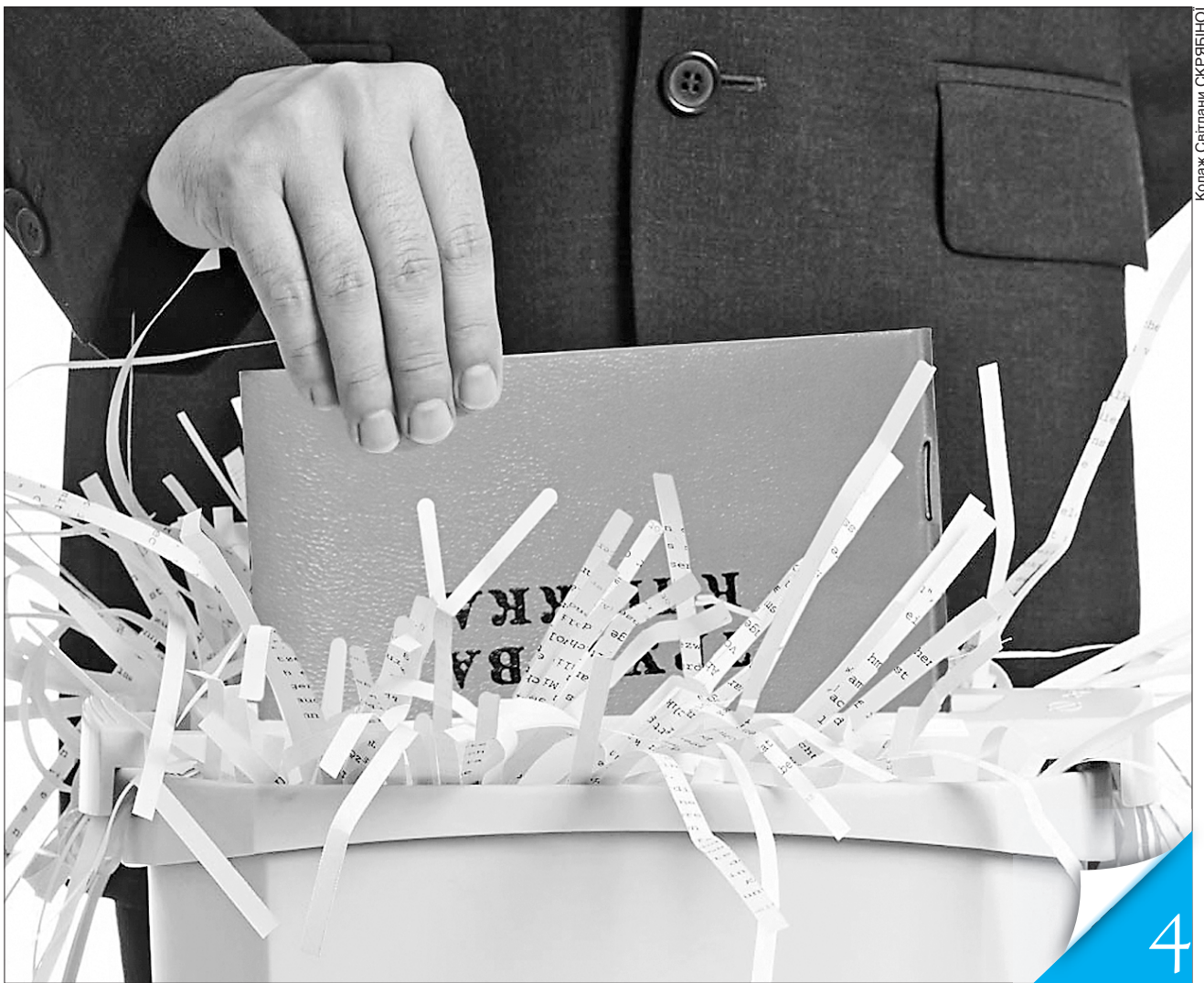
Коллаж Світлани СКРЯБІНО