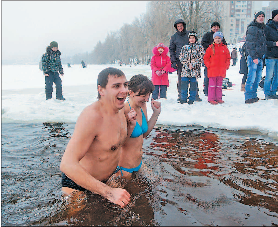
Куди вода — туди й біда: українці вірять, що очистяться від усілякої скверни

Різдвяні свята тривають два тижні — до Водохрещі; 7 січня — початок зимових м'ясниць. Святковий стіл щедро накривають різноманітними скоромними стравами. Вдосвіта діти вітають колядками родичів і