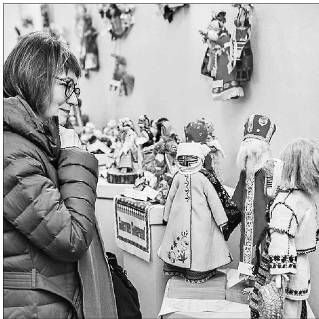
Придивися: може, і твій оберіг чекає тебе на виставці

За задумом організаторів виставковий проект спрямований на реконструкцію українського народного костюма, репрезентацію автентичних жіночих образів, відтворення обрядів і звичаїв традиційної української культури. Традиційні ляльки-мотанки, лялькові композиції,