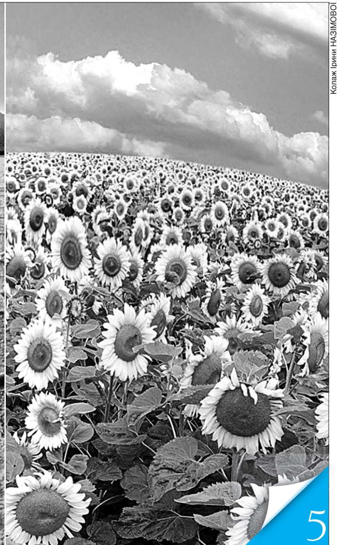
Колаж Ірини НАЗІМОВО

ТЕРМІНОВО. Українці мають створити і втілити план запобігання змінам клімату