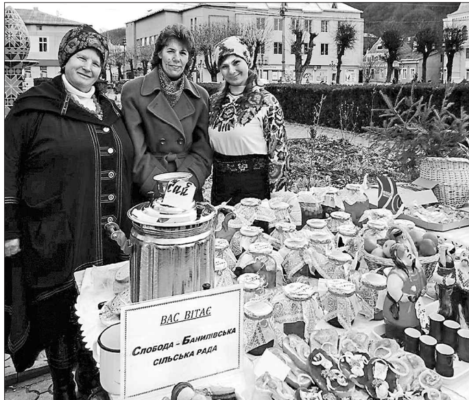
На ярмарку завжди можна поєднати корисне і приємне: придбати гарні речі і зустріти добрих знайомих

У рамках ярмарку відбувся традиційний чайний фестиваль. А насамкінець усі охочі мали змогу придбати різноманітну сільськогосподарську продукцію, пригоститися дарами полів, садів, іншою смакотою.