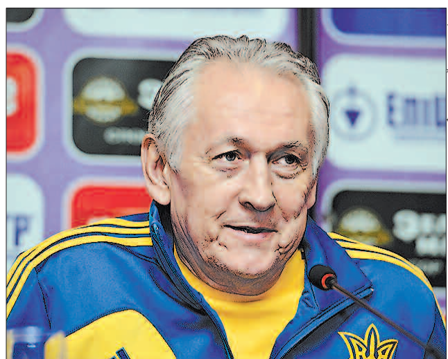
Михайло Іванович уже означив ключові дати підготовки до Євро-2016: 19 травня команду почнуть навантажувати, щоб підготувати якнайліпше