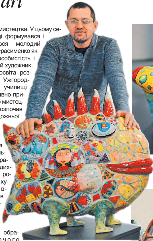
Красномовно-безмовні й завжди усмінені герої Герасименка дивляться широкорозплющеними очима

рові вдається дуже гармонійно згрупувати у фантастичний колаж. У розмаїтті сюжетів зустрічаються люди, тварини, гори і море, хмари і літаки, будинки й дерева... Нині виставку робіт митця експонують у Музеї історії Києва.