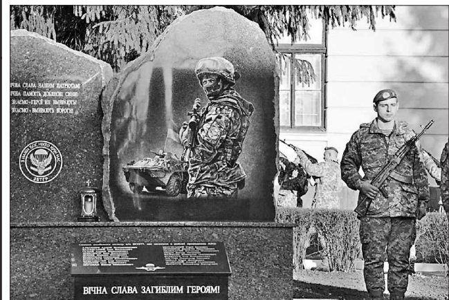
На чорному граніті золотом викарбувано імена героїв-десантників, перед якими схиляють голови ті, за кого вони віддали життя