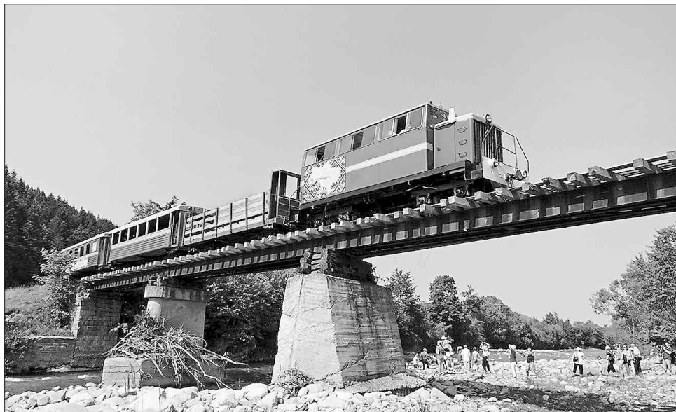
Карпатський трамвай знову на висоті у розвитку туристичної галузі Прикарпаття

Захід був своєрідним святкуванням 15-річчя започаткування на Івано-Франківщині, в селищі міського типу