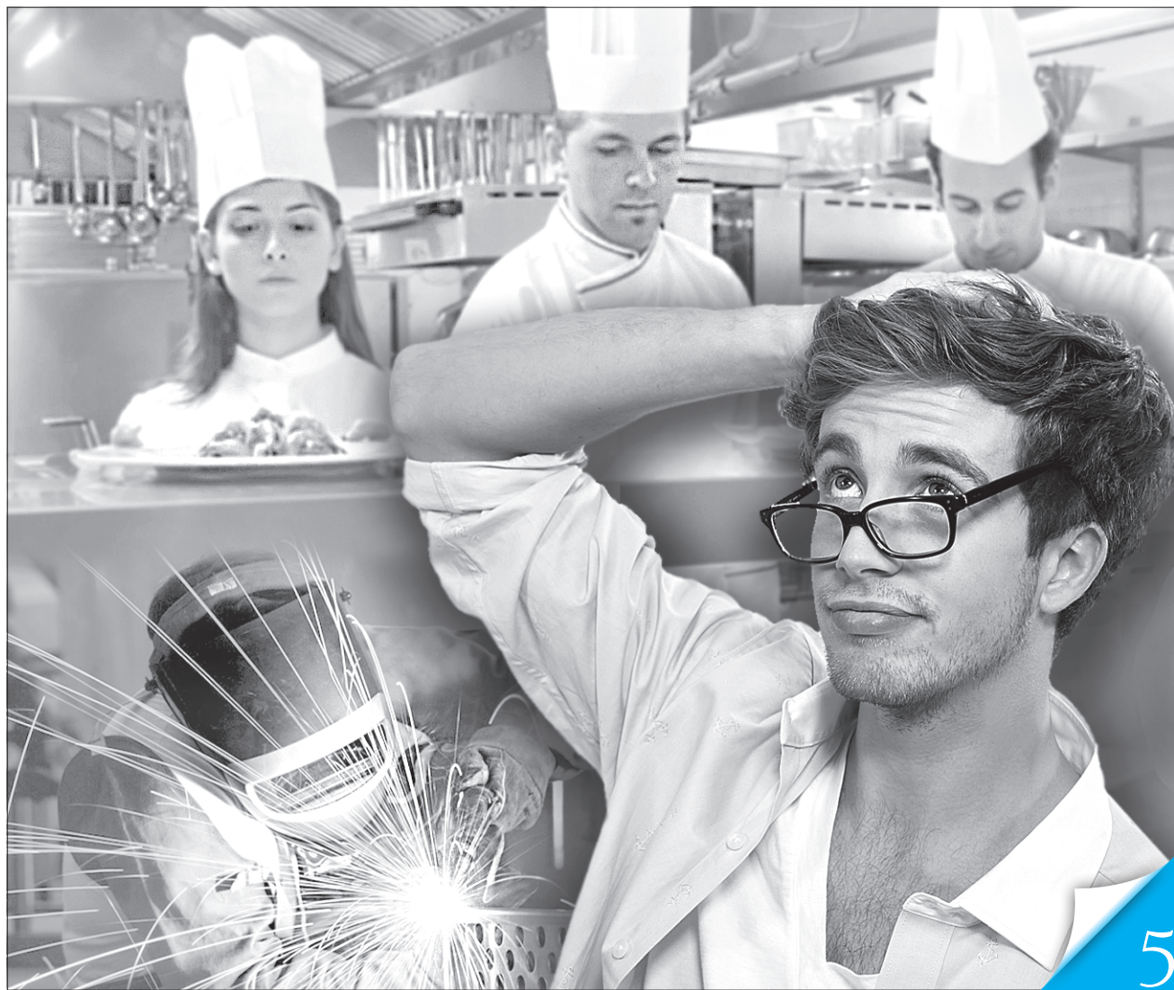
Колаж: Ірина НАЗІМОВА