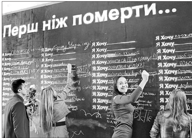
У кожного — власна мрія-прагнення

Цей глобальний проект закликає людей поділитися власними потаємними бажаннями-мріями, найдорожчим. З часу його започаткування такої захід уже організували в 76 країнах тридцятьма шістьма мовами. А ініціювала акцію чотири роки тому Кенді Ченг з американського Нового Орлеану. Втрапивши дорогу їй людину, вона замислилася над цінністю часу, прагненнями і вирішила привернути увагу своїх співвітчизників до їхнього життя. Стіну одного з покинутих старих будинків Кенді разом з друзями перетворила на величезну дошку й вивела на ній: Before I die, I want to... («Перед тим як помру, я хочу...»). Вже наступного дня поряд з цими словами не було вільного місця — люди за допомогою шматочка крейди ділилися сокровенним. Відтак починання американки поширилося не лише в її країні, а й у багатьох державах світу. Тепер його підтримали й українці.