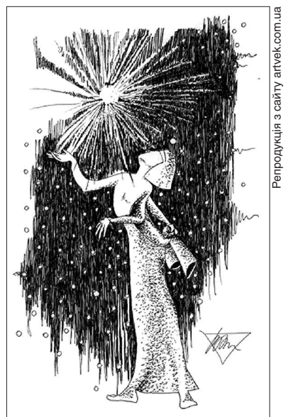
У своїх словах поетеса так само відверта, як і в творах, — її герої тягнуться назустріч сонцю