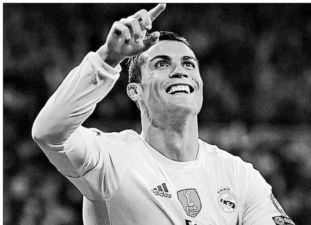
Роналду — зірка групи А

«Звісно, ми не заслугоували поразки: добре провели матч, були організованими,