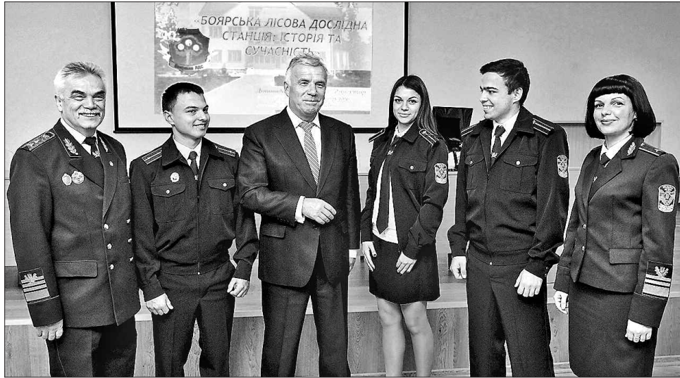
У Боярці ліс розкриє свої таємниці

Щорічно приблизно 500 студентів проходять тут навчальні практики. Відтепер вони мають змогу протягом цілого року набу-