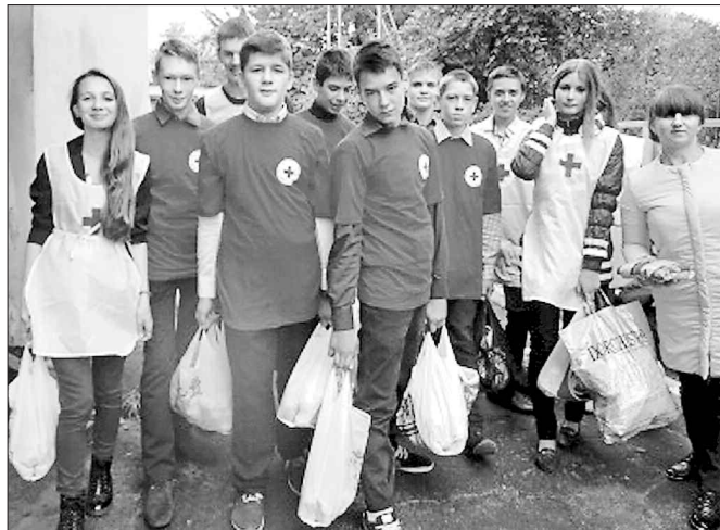
Уманські волонтери несуть ветеранам не тільки продукти, а й свою увагу до їхніх проблем

Товариство також надає адресну допомогу взуттям, одягом, продуктами харчування, засобами особистої гігієни та іншими необхідними в побуті речами переселенцям зі сходу України, які проживають на території району.