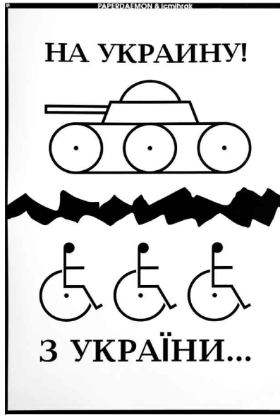
Відвідувачі жваво обговорювали як тематику робіт, так і виконання