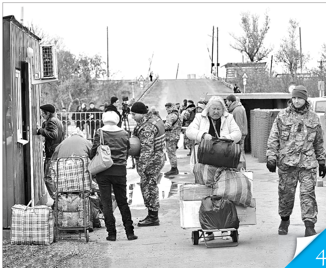
У чергах на пунктах в'їзду-виїзду багато пенсіонерів, які їдуть у прифронтові міста по дешеві харчі

КОРДОН. «УК» проаналізував, чому пропускна система працює незадовільно