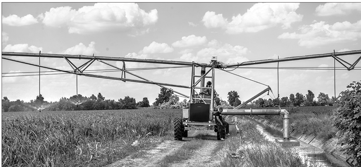
Відновлення зрошення в зонах ризикованого землеробства — на сьогодні актуальна тема як для аграріїв, так і для держави

Науковці на основі наявних даних спробували змоделювати, що станеться з вітчизняним кліматом і водними ресурсами у 2050 та 2100 роках. Вийшло, що до 2050-го середньорічна температура зросте на 2,2—2,5 градуса, до 2100-го — на 3,1—3,3 градуса, тоді як кількість опадів у південних регіонах не збільшиться. Зросте і випаровування вологи, зменшаться річкові стоки, і сільському господарству критично не вистачатиме води. 2050 року дефіцит вологи становитиме 550—570 мм. Це фактично показники пустелі. До 2100 року дефіцит води охопить 60% території України. Заобів-