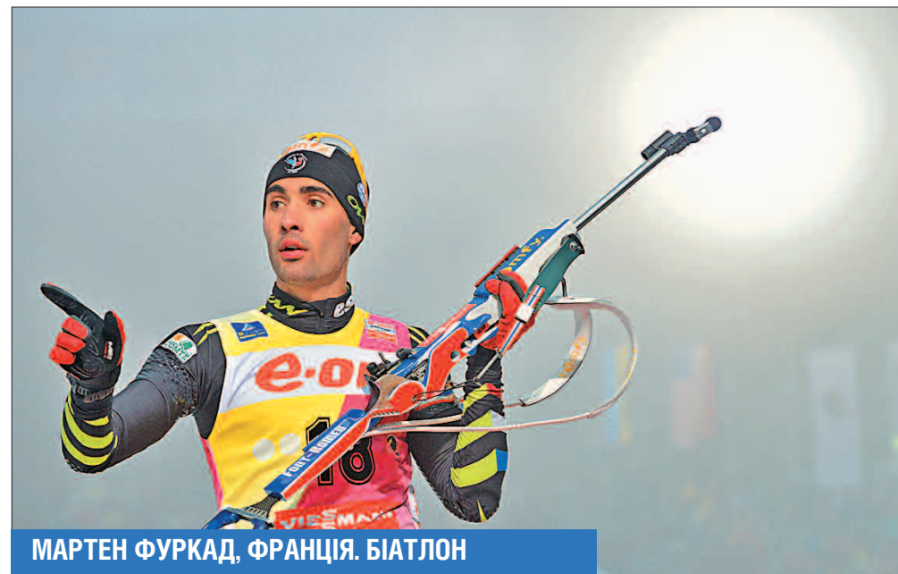
МАРТЕН ФУРКАД, ФРАНЦІЯ. БІАТЛОН

«Спортсменка року» в Норвегії їде в Сочі в статусі чинного лідера загального заліку Кубка світу та індивідуальних гонок. Нині дискутують лише питання: скільки дорогоцінного металу вона привезе з Росії.