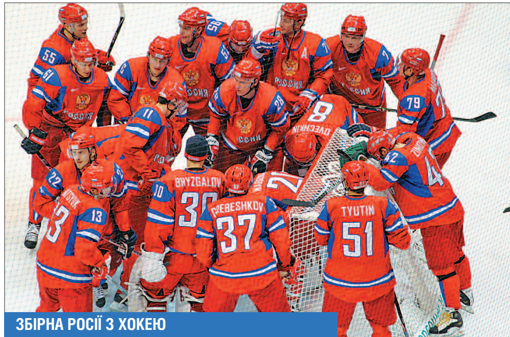
ЗБІРНА РОСІЇ З ХОКЕЮ

Головне — не перемога, а участь. Це олімпійське гасло жодним чином не задовольняє тих, хто налаштований відчутти найсолодший смак саме на своїх губах, особливо якщо для цього є вагомі підстави. Сьогодні на XXII зимових Олімпійських іграх у Сочі розіграють перші з 98 комплектів нагород. Загалом з 8 по 23 лютого визначаться переможці у 15 дисциплінах під егідою семи міжнародних спортивних федерацій. «Урядовий кур'єр» пропонує ближче придивитися до фаворитів нинішньої Олімпіади, для яких навіть друге місце може перетворитися на особисту трагедію.