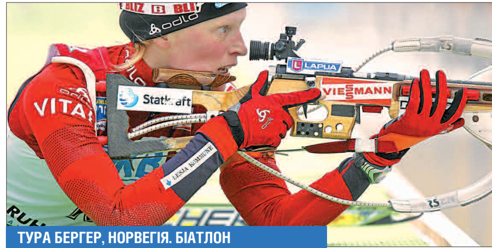
ТУРА БЕРГЕР, НОРВЕГІЯ. БІАТЛОН

Нинішня ситуація така, що німецька пара Альона Савченко / Робін Шолкови мало стабільна, а китайській Пан Цин / Тун Цзянь не вистачає популярності, щоб вважатися рівнею Волосожар і Транькову, які за останній півроку оновили всі світові рекорди в парному катанні: у жовтні з 30-бальною перевагою виграли Skate America, отримавши 237,71 у сумі і 154,66 за довільну програму, а з Будапешта повернулися чемпіонами Європи з 83,98 за свій короткий прокат.