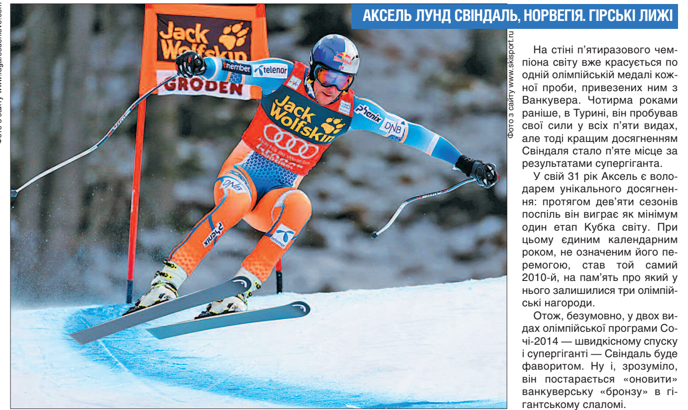
АКСЕЛЬ ЛУНД СВІНДАЛЬ, НОРВЕГІЯ. ГІРСЬКІ ЛИЖИ

Тіна претендує на медалі у всіх дисциплінах. А які з п'яти їй підкоряться, стане зрозуміло лише в Сочі.