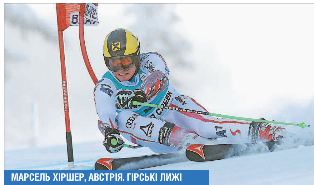
МАРСЕЛЬ ХІРШЕР, АВСТРИЯ. ГІРСЬКІ ЛИЖИ