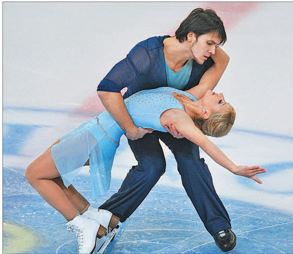
ТЕТЯНА ВОЛОСОЖАР І МАКСИМ ТРАНЬКОВ, РОСІЯ. ФІГУРНЕ КАТАННЯ

Звісно, здобути найпрестижнішу командну медаль на домашніх іграх було б здорово. Втім, принаймні у кількох збірних є своя думка щодо цього. А фаворитом здебільшого називають головного претендентом на хокейне «золото» збірну Швеції.