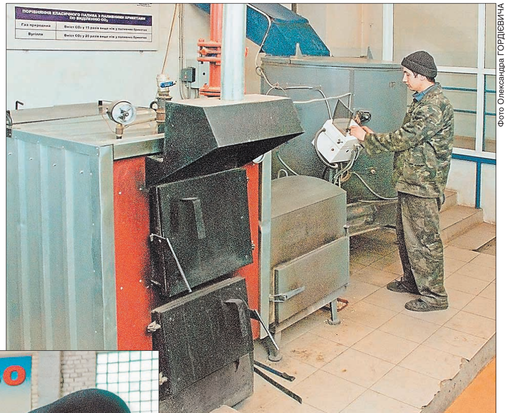
Ось такі котли з автоматичною подачею трісок і брикетів передає школам на умовах оренди комунальне підприємство «Віноблагроліс»

Поки що «Віноблагроліс» за рік заготовляє 150 тис. м 3 дров, що еквівалентно 40 млн м 3 газу. Для порівняння: область на ви-