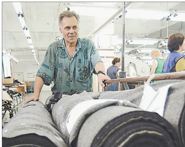
На прозоро працюючі підприємства податківці накладають мораторій на перевірки

УК Однак підприємці скаржаться на посилення фіскального тиску.