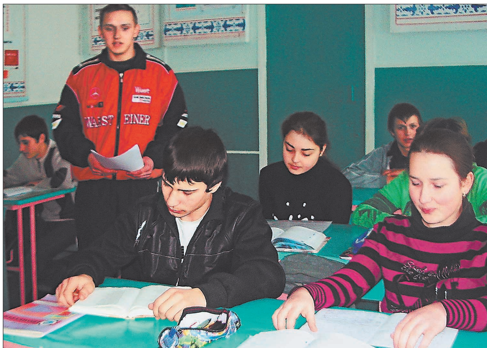
За роки незалежності кількість учнів у сільській школі подвоїлася