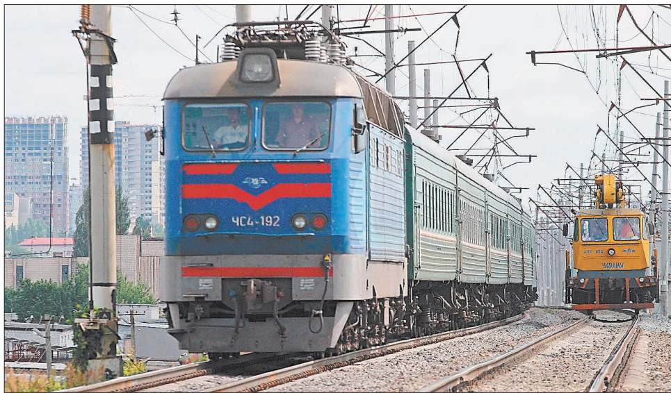
Денний, але ще не швидкий

У подальшому, розділивши пасажирські та вантажні напрямки, визначать кілька пасажирських транспортних коридорів. Тобто сформуєть внутрішньодержавні пріоритетно пасажирські, суто пасажирські, а також вантажні транспортні коридори. На пріоритетно пасажирських залишаться маршрути міжрегіональних нічних поїздів, що певний час ще будуть актуальними. Переважно це поїзди, які з'єднують західний і східний кордони України (приміром, Донецьк—Ворохта, Львів—Сімферополь). На суто пасажирських напрямках організують швидкісний рух і там не курсуватимуть вантажні поїзди. Ці напрямки стануть базовими для повноформатних магістралей зі швидкістю понад 200 км/год. На вантажних транспортних коридорах створять бізнес-майданчик для вантажних перевезень і транзиту, знайдуть місце й для кур-