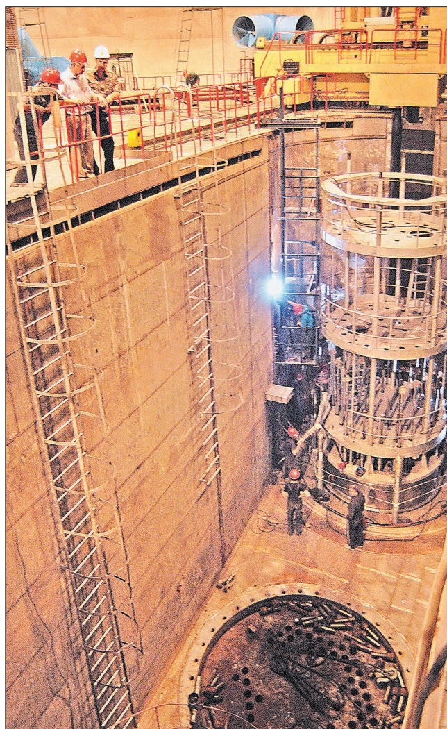
А у китайців реактори дешевші

Таким чином наш маленький крок у напрямку диверсифікації джерел постачання ядерного палива і створення власного ядерно-паливного циклу, яке задеклароване у програмі енергетичного розвитку України до 2030 року, став лакмусовим папірцем у партнерських відносинах з Російською Федерацією в енергетичній царині. Сподіватимось, що під час переговорів буде досягнуто розумного компромісу за умови максимального забезпечення національних інтересів України.