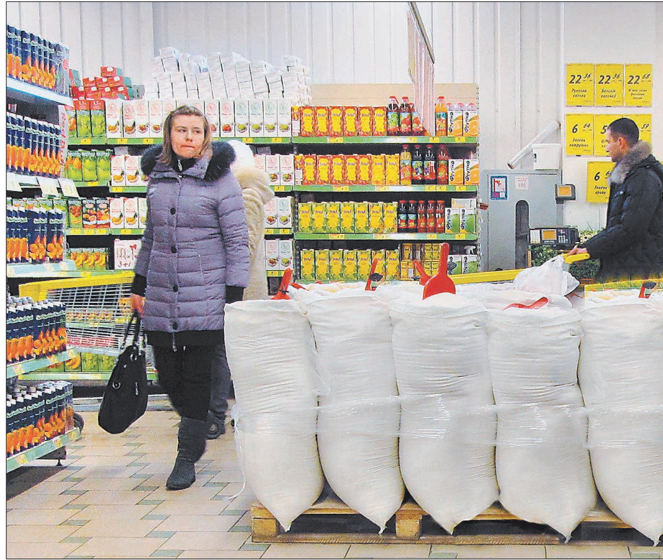
Мішків багато, але борошна в них немає, бо все пакетоване

— Україна повністю інтегрована в світову економіку. І коли починають зростати світові ціни, в першу чергу це стосується енергоносіїв та продуктів харчування, а така тенденція спостерігається цього року, це не може не зачепити й нас. Раніше ми експортували достатньо велику кількість зернових культур і були одними з лідерів у світі. В цьому році, щоб стримати зростання цін, уряд обмежив експорт. Але річ у тому, що селяни останніми роками навчилися аналізувати ціни на світових біржах, тому не хочуть продавати свою