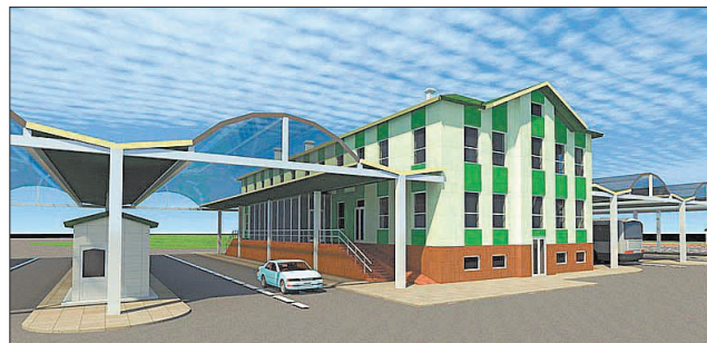
Такий вигляд матиме міжнародний автоперехід «Устилуг» після реконструкції, що завершиться вже цього року

топереходу та постійний розвиток торговельних зв'язків із Польщею забезпечили тут високу інтенсивність руху. Через перехід Устилуг — Зосин нині кожні 24 години в середньому проїжджає 1600 — 1800 транспортних засобів. Після реконструкції його пропускна спроможність значно зросте. Тут щодоби зможуть пересікати кордон з Євросоюзом 2500 легкових автомобілів, до 300 вантажівок загальною спорядженою масою до 3,5 тонни, два десятки автобусів. П'ять смуг пропуску, що діятимуть за принципом «єдиного вікна», дадуть змогу семи тисячам