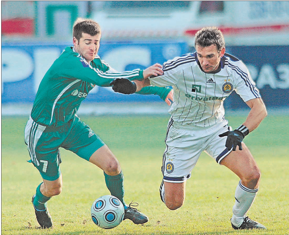
Уболівальників чекають захоплюючі баталії

Іллічівець – Зоря Карпати – Шахтар Металіст – Дніпро Динамо – Ворскла