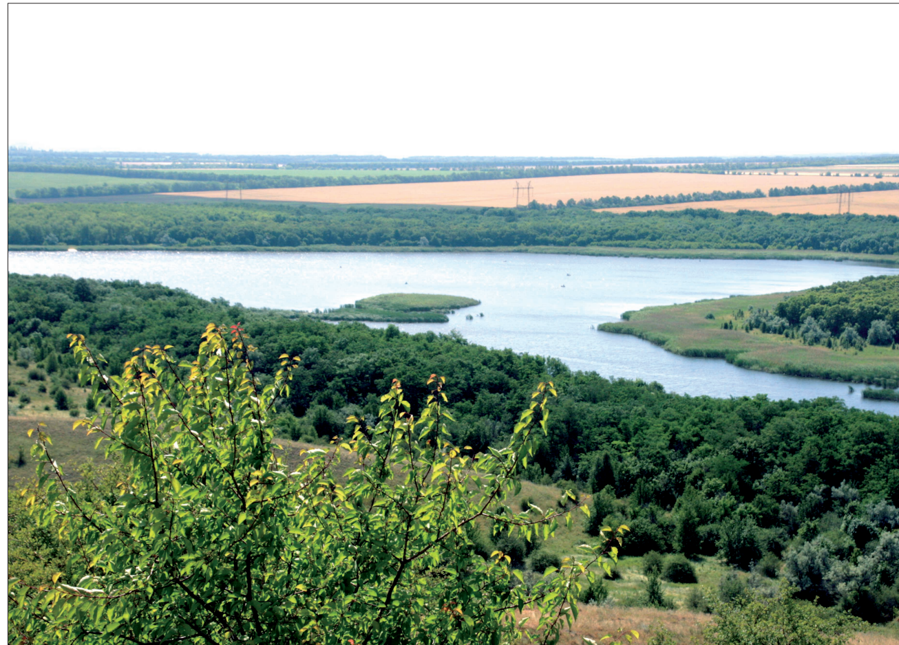
Красиви ландшафтного парку «Клебан-бик»

ДОНЕЦЬК. Індустріальний край пропонує захоплюючі подорожі природними перлинами