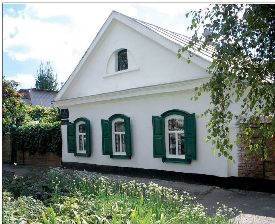
Тут ходив юний Рєпін

Мій гід — працівниця комунального закладу «Художньо-меморіальний музей І. Ю. Рєпіна» Галина Єрмошенко — запропонувала екскур-