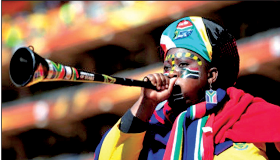
Вувузела: очам — захоплення, вухам — страждання

Розповідають, що назва «вувузела» походить з мови зулу й означає «створювати шум». І справді, цей інструмент повністю виправдовує свою назву: рекордний рівень шуму для вувузели — 130 децибел (південноафриканські закони зобов'язують людей використовувати засоби захисту для вух, якщо рівень шуму перевищує 85 децибел). За однією з версій, цей «голосистий» інструмент винайшов 1970 року південноафриканець Фредді Маакі, який вирішив на футбольні матчі приносити свою дудку від велосипеда, яку згодом йому вдалось удосконалити. Тепер вувузели — всуціль пластиківі. Особливої популярності вони набули