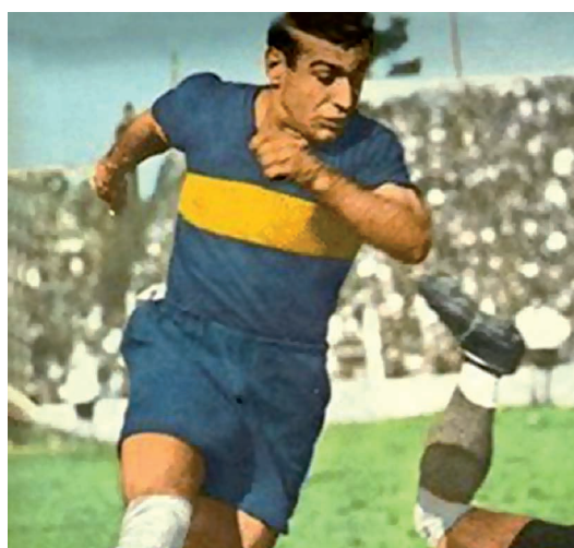
Він був легендою «Бока Хуніорс»

Варальйо міг і не зіграти в тому матчі. У попередній грі проти Чилі він пошкодив коліно. Проте у фіналі він таки вийшов на поле, і один з голів аргентинської збірної був забитий за його особистої участі. «Всі мене запитують про