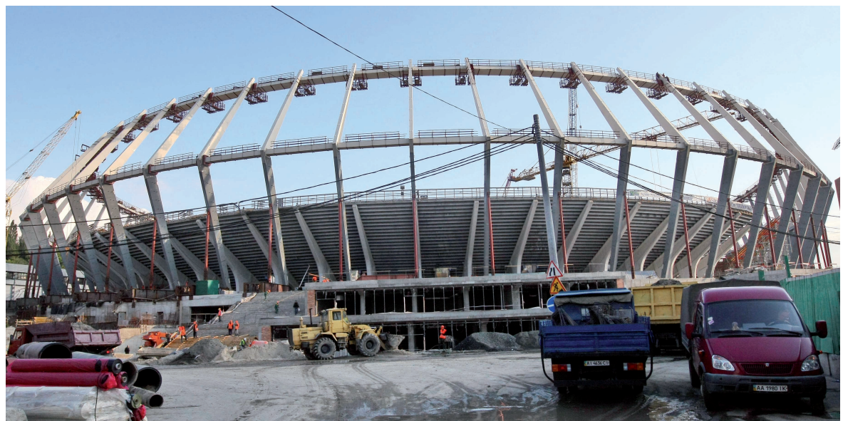
НСК «Олімпійський» набуває європейських контурів