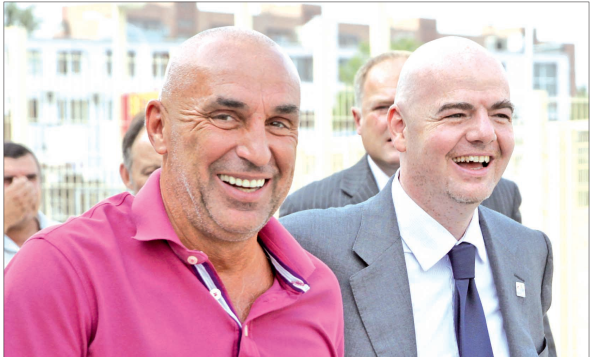
Олександр Ярославський та Джанні Інфантино задоволені тим, як готується Харків до Євро-2012

— Жодного секрету. Просто треба працювати. Менше слів, більше справ. А щодо несподіваних темпів... Останнім часом