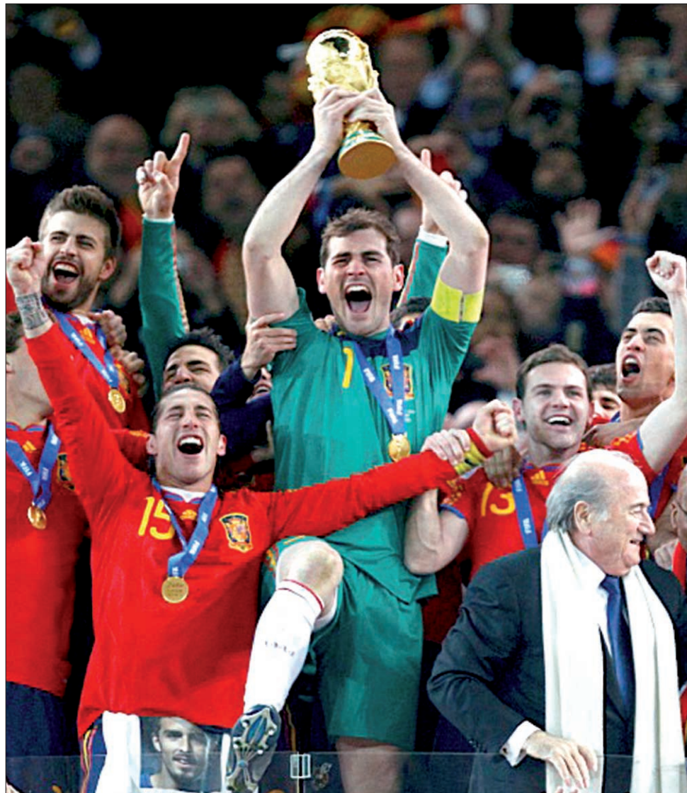
Іспанці хотіли б святкувати перемогу і на Євро-2012

— Ми зробили висновки з того, що з нами трапилося на полях Південної Африки, — заявив після завершення мундіалу головний тренер бундестім Йоахім