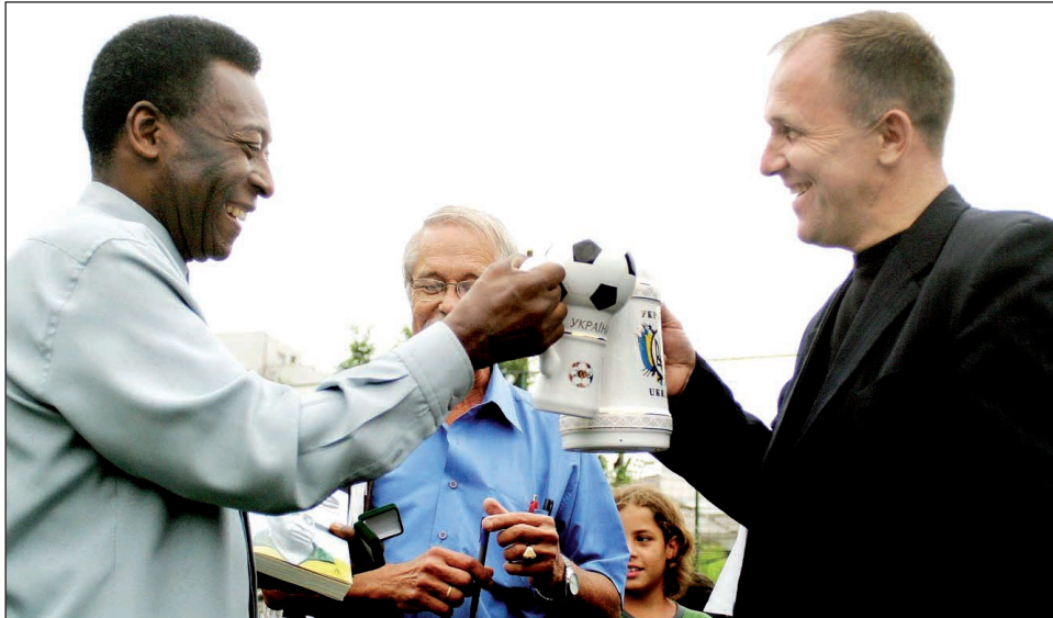
Зустріч кумира і його шанувальника

— Я не міг стримати сліз радості, — згадує Микола. Він подолав тоді всі кордони, бар'єри, митниці. Навіть у Російському футбольному союзі не всі знали про приїзд великого спортсмена, бо прилетів Пеле скромно, як представник компанії «Касіке», що випускає розчинну каву із зображен-