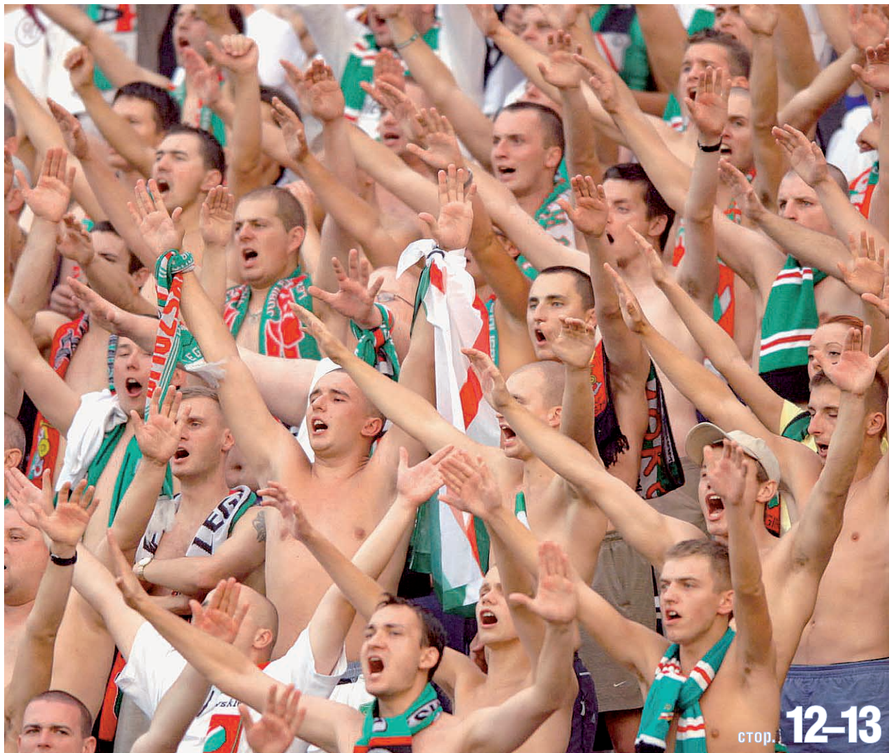
Польські вболівальники двома руками підтримали ідею проведення наступного європейського футбольного турніру в Україні і Польщі

має намір виділити Європейський банк реконструкції і розвитку на будівництво автомобільних під'їздів до Києва у рамках підготовки до Євро-2012. Цей проект Рада директорів банку розглядатиме 28 вересня.