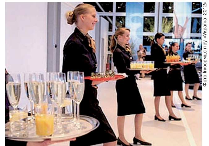
Зустрінуть з усмішкою

Розміщенням та харчуванням офіційних гостей УЄФА в Україні та Польщі під час Євро-2012 одноосібно опікуватиметься австрійська компанія DO & CO. Вона стала переможцем тендера УЄФА щодо надання таких послуг.