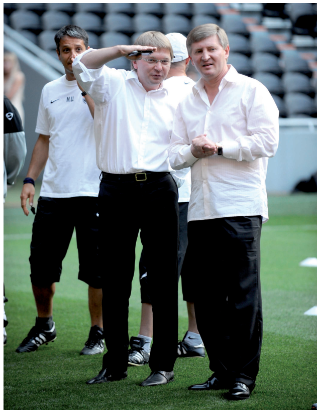
Керівництво ФК «Шахтар» намагається зазірнути у далеку перспективу