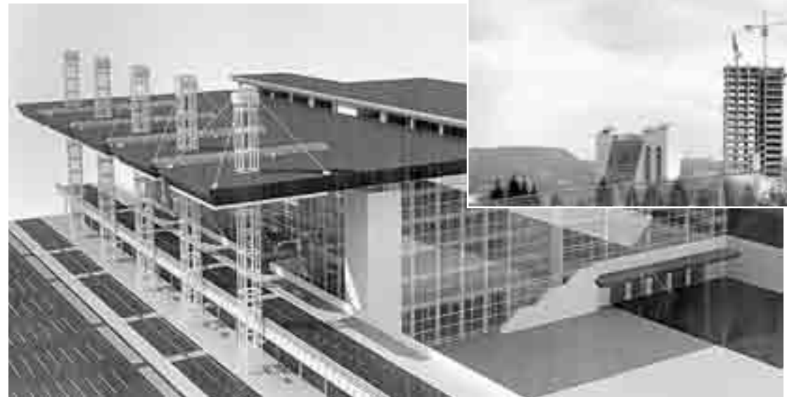
До вересня 2011 року аеропорт «Донецьк» набуде європейського рівня

— Після відкриття 50-тисячного стадіону «Донбас Арені», спроектованого та збудованого ФК «Шахтар» відповідно до стандартів УЄФА, ми отримали можливість заздалегідь відпрацювати управління транспортною системою під час великого сукупного вболівальників у центрі міста. Тобто, місто вже зараз працює в