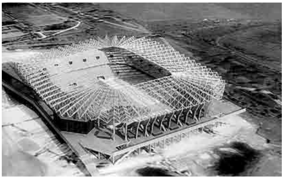
Львівський стадіон у 2011 році здивує найприскливіших ревізорів

— Проведення чемпіонату Європи з футболу 2012 року у Львові є національним пріоритетним проектом, — запевнив голова облдержадміністрації Василь Горбаль. — Кабінет Міністрів затвердив Державну цільову програму підготовки та проведення в Україні Євро-2012, її вартість для Львівської області становить 18 млрд грн.