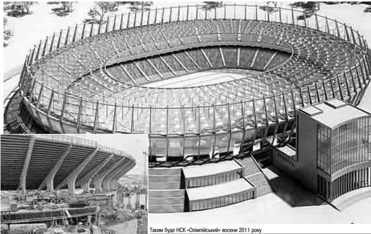
Таким буде НСК «Олімпійський» восени 2011 року

— Схоже на те, що саме конструкція покриття стане предметом гордості футболістів арени у Києві і Варшаві, — розказав польський посадовець журналістам. — Дах над «Олімпійським», загальна площа якої складатиме майже 50 тис. м 2 — це, дійсно, дуже амбітне архіте-