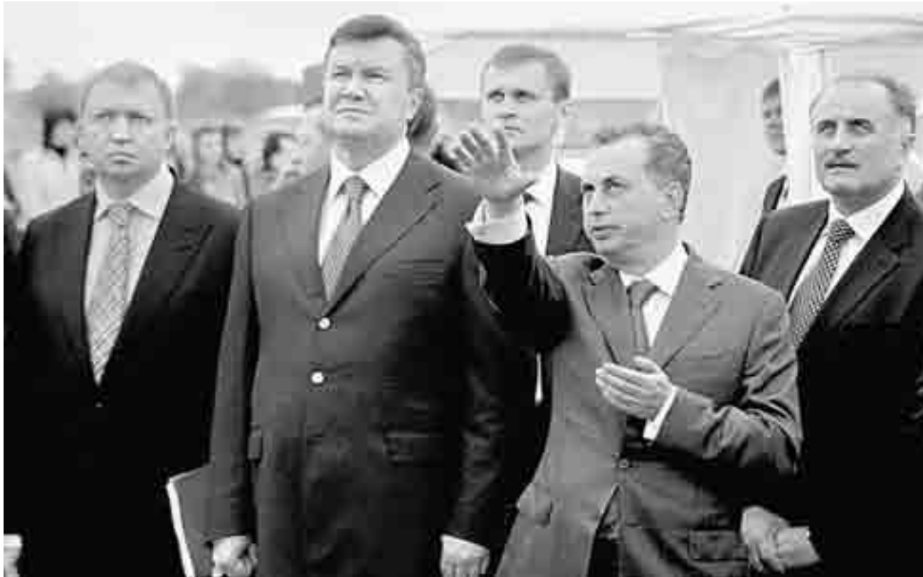
Президент Віктор Янукович уважно вивчає стан готовності об'єктів Євро-2012

Виступаючи перед учасниками міжнародної конференції «Євро-2012: довгострокові можливості інвестицій у сектор готелів та відпочинку в Україні», Президент Віктор Янукович наголосив, що Україна впевнено налаштована на реформи.