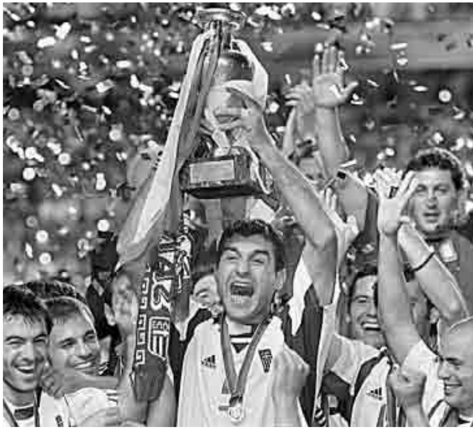
У Португалії перемогу виборола збірна Греції

Підготовка до Євро-2004 велася в умовах форс-мажору