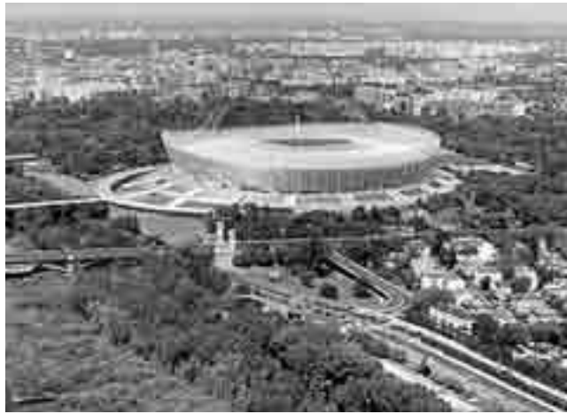
Стадіон-красень виростає у столиці Польщі

В угоді, укладеній з містом, виконавець зобов'язався завершити зведення трьох трибун стадіону в травні 2010 року, однак Полілекс звернувся за проханням до влади міста дати згоду на подовження терміну — до кінця липня. Фірма подвоїла кількість робітників до 800. Директор Варшавського центру спорту і рекреації Януш Копаняк стверджує, що звернення Полілексу є цілковитим обгрунтованим, оскільки з огляду на несприятливі погодні умови деякі техноло-