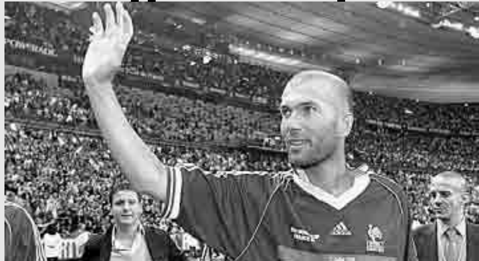
Зідан радий, що Євро повертається до Франції

Результат оголосив президент УЄФА Мішель Платіні, який був капітаном збірної Франції, коли 1984 року європейський турнір проводився у Франції і ця країна стала чемпіоном Європи.