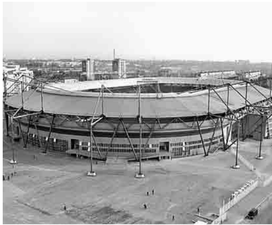
Серце чемпіонату Європи з футболу у Харкові — стадіон «Металіст»

бюджетів, щоб прискорити доведення до готовності головних об'єктів інфраструктури. Інвестори також згадали час за колишньої влади, бо жодного