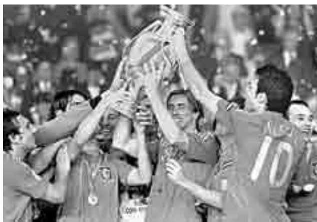
Приз кращій команді Європи

Проте ідея не загинула, у неї були й впливові прихильники. Це на початку вузьке коло одностороннє поставило за мету згуртувати європейські футбольні асоціації, утворивши на протидію ФІФА свій континентальний орган. Історичною в цьому процесі стала конфе-