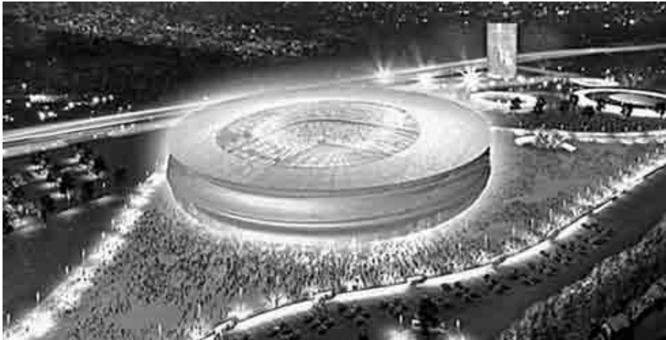
Такою буде футбольна арена у Познані

У Познані пан Каллен провів лише три години. За цей час він встиг побувати на міському стадіоні та в аеропорту Лавіца, а також провести розмову з владою міста.