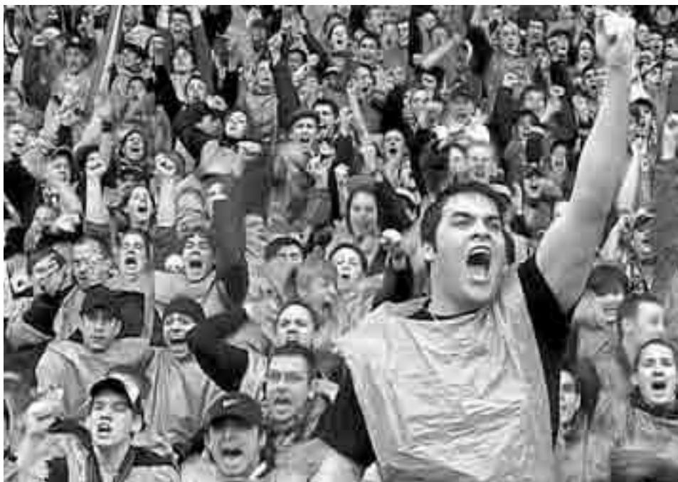
Буде футбольне свято і на нашій вулиці!

Організатори Євро-2004 вклали в проект приблизно 700 млн євро, не рахуючи коштів регіонів, місцевих футбольних клубів, а також грошей, які залучила спеціально створена УЄФА маркетингова компанія. Понад мільйон уболівальників із різних країн, розраховуючись за номери