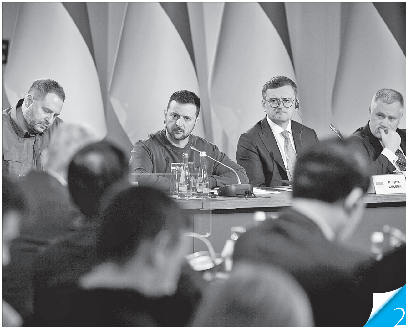
Володимир Зеленський сподівається, що майбутній саміт у Швейцарії буде результативним

СПІЛЬНИМИ ЗУСИЛЛЯМИ. Президент закликав дипломатів поширювати правду про війну та допомагати посилювати нашу ППО