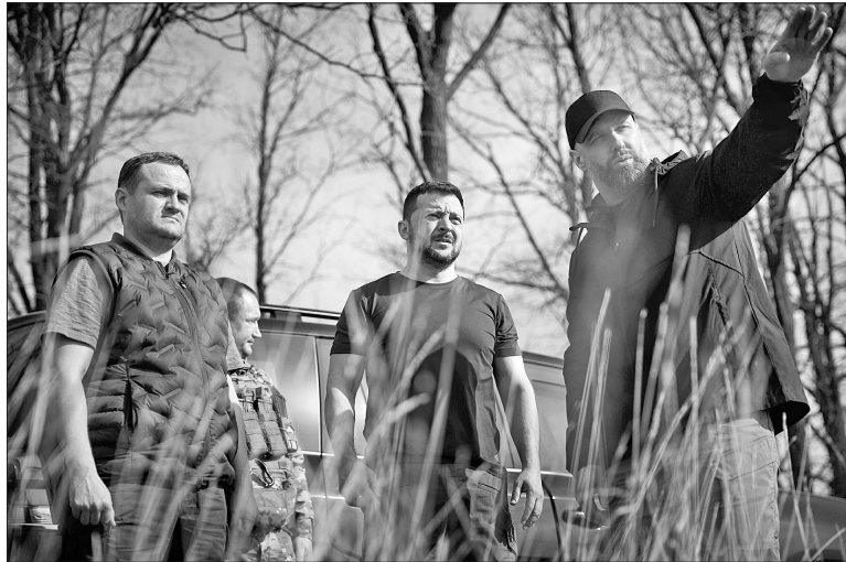
Володимир Зеленському доповіли про наслідки російських обстрілів та перспективу відновлення енергогенеруючих потужностей

Також на нараді розглянули найактуальніші соціальні питання для регіону. Начальник Харківської ОВА та міністр освіти і науки Оксен Лісовий представили план організації офлайн-навчання в окремих районах Харкова з 1 вересня цього року. Кошти на будівництво шкільних укрит-