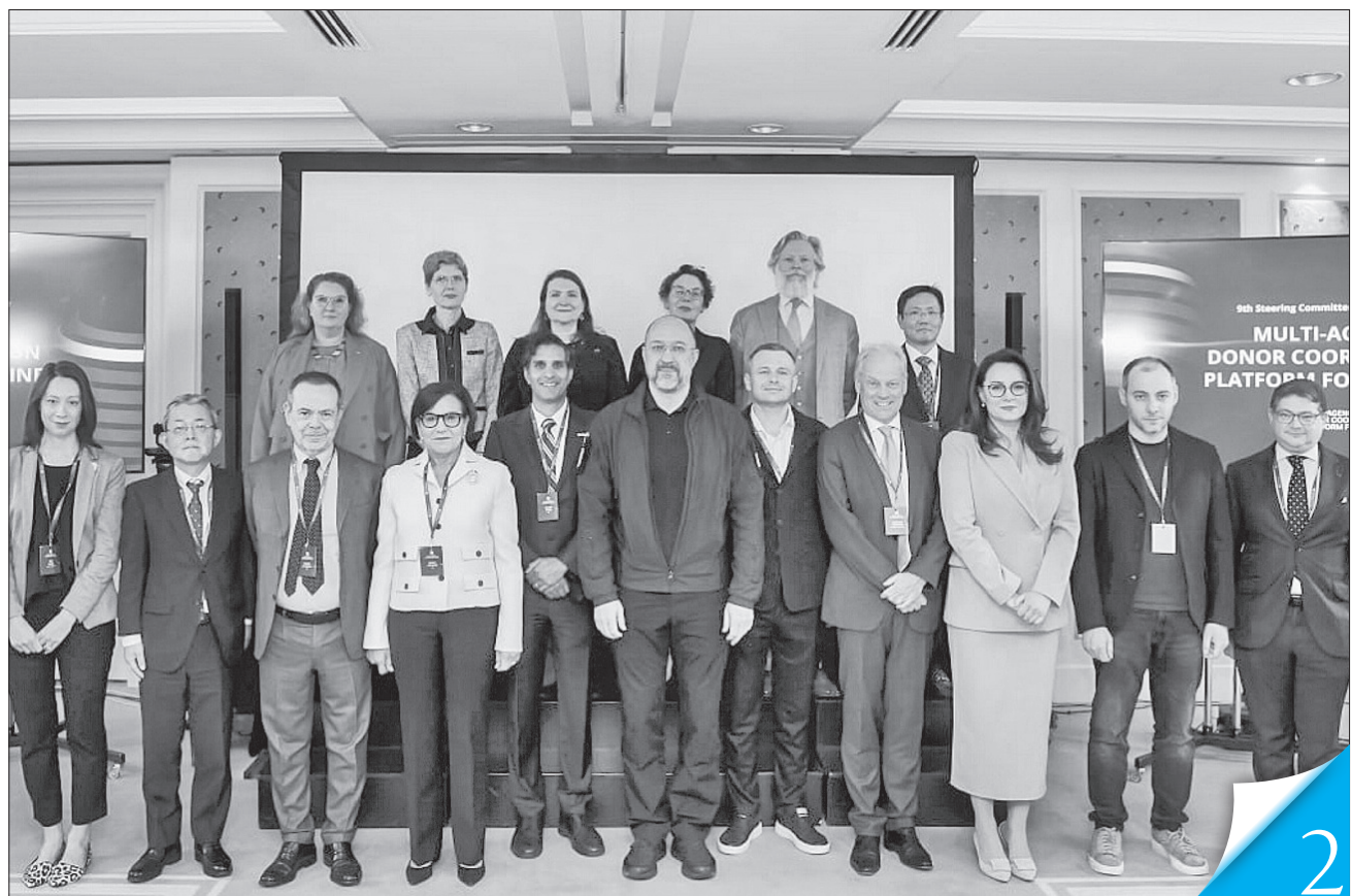
Учора члени керівного комітету вперше зібралися в очному режимі в Києві

МАКРОСТАБІЛЬНІСТЬ. Прем'єр означив три стратегічні завдання Багатосторонньої координаційної платформи донорів