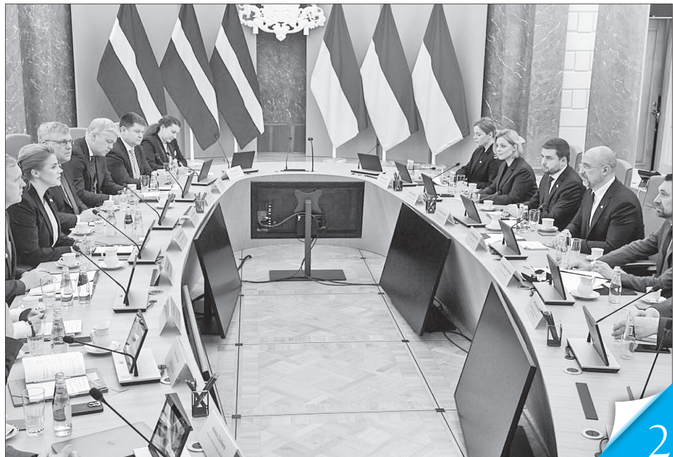
Урядовці двох країн провели плідні та конструктивні переговори з широкого кола питань

ДВОСТОРОННІ ВІДНОСИНИ. За словами українського Прем'єра, найближчим часом буде запущено спільне виробництво безпілотників