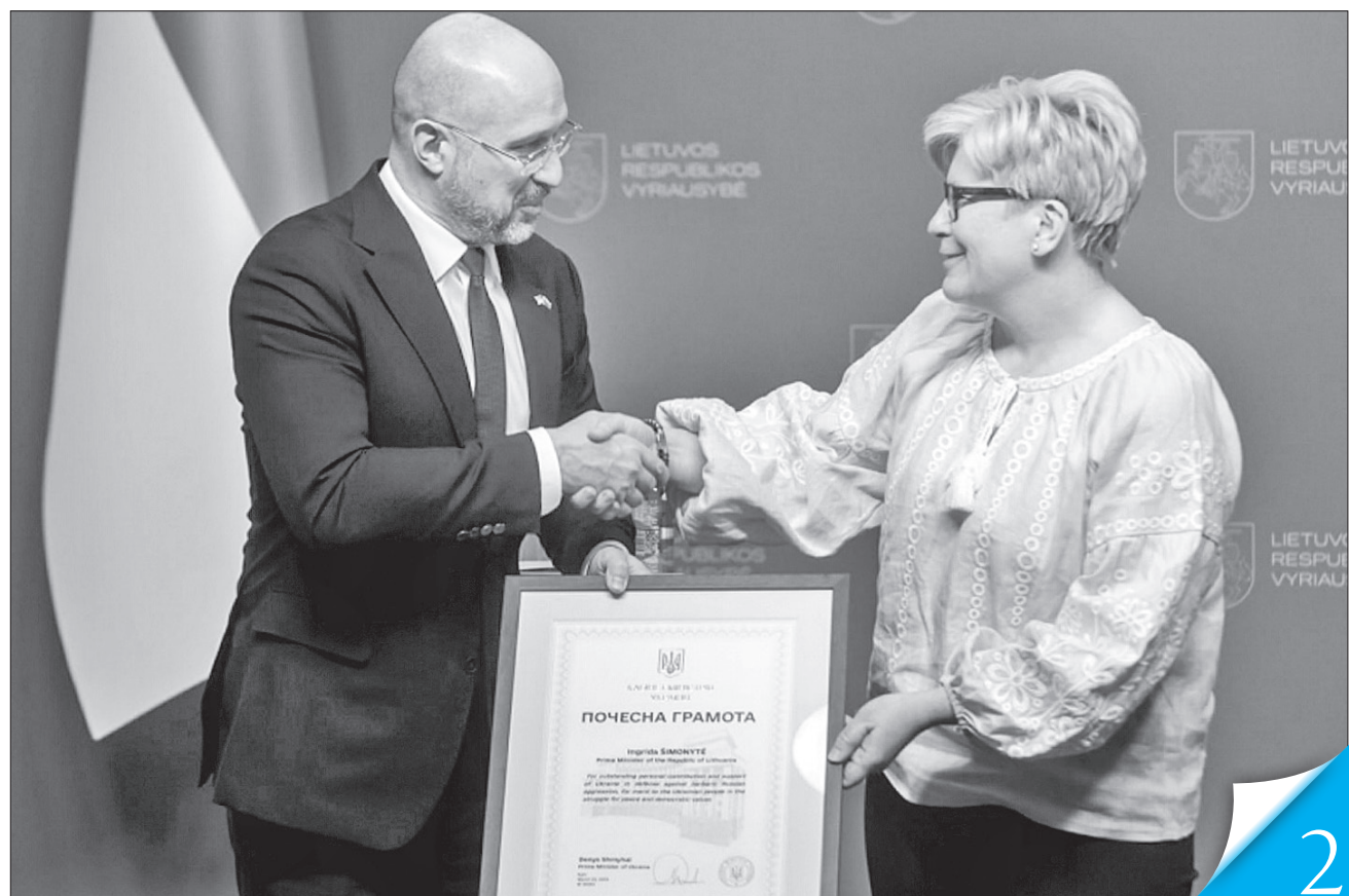
Денис Шмигаль вручив литовській колезі Індрізі Шимоніте почесну грамоту за всебічну підтримку від дружнього народу

РОБОЧИЙ ВІЗИТ. Прем'єр-міністр повідомив, що ця країна Балтії закупить для наших захисників 3 тисячі безпілотників власного виробництва