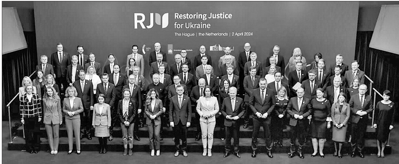
Учасники міністерської конференції ухвалили вагомий для українців рішення

«Я був у Бучі, — сказав Президент, — в місті, яке для всього світу стало символом російського зла. Усі ви пам'ятаєте, що було на вулицях Бучі, коли з них вигнали російських окупантів. Пам'ятаєте, скільки там залишилося тіл убитих людей і як це все було. Пам'ятаєте, що відкрилося, коли ми почали знаходити масові поховання закатованих українців. Відтоді минуло два роки, а досі не вдалося навіть встановити імена всіх, кого вбили російські солдати, — досі в Бучі є безіменні могили. Як і в багатьох інших наших громадах, які було звільнено від російської окупації. І хоч різні міста й села поступово відновлюються, в кожному з них є таке особливе відчуття, однакове для всіх: відчуття того, що ще дуже багато роботи попереду — роботи саме заради справедливості. Заради того, щоб зло остаточно програвало — і фізично, у реальності, на полі битви, і так, щоб це було переконливо для людських сердець. І щоб кожен, хто потім прийде у російську владу після путіна, знав: справедливість міцні-