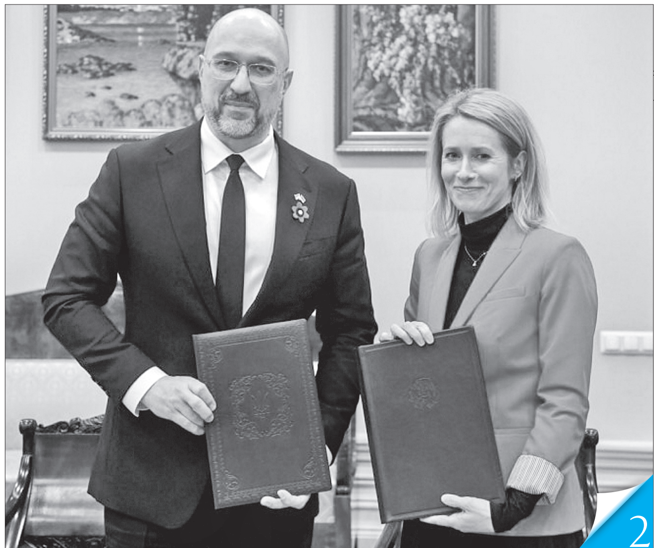
Очільники урядів України й Естонії Денис Шмигаль і Кая Каллас за підсумками зустрічі підписали спільну заяву

РОБОЧИЙ ВІЗИТ. Прем'єр-міністр учора особисто подякував за це високопосадовцям балтійської країни