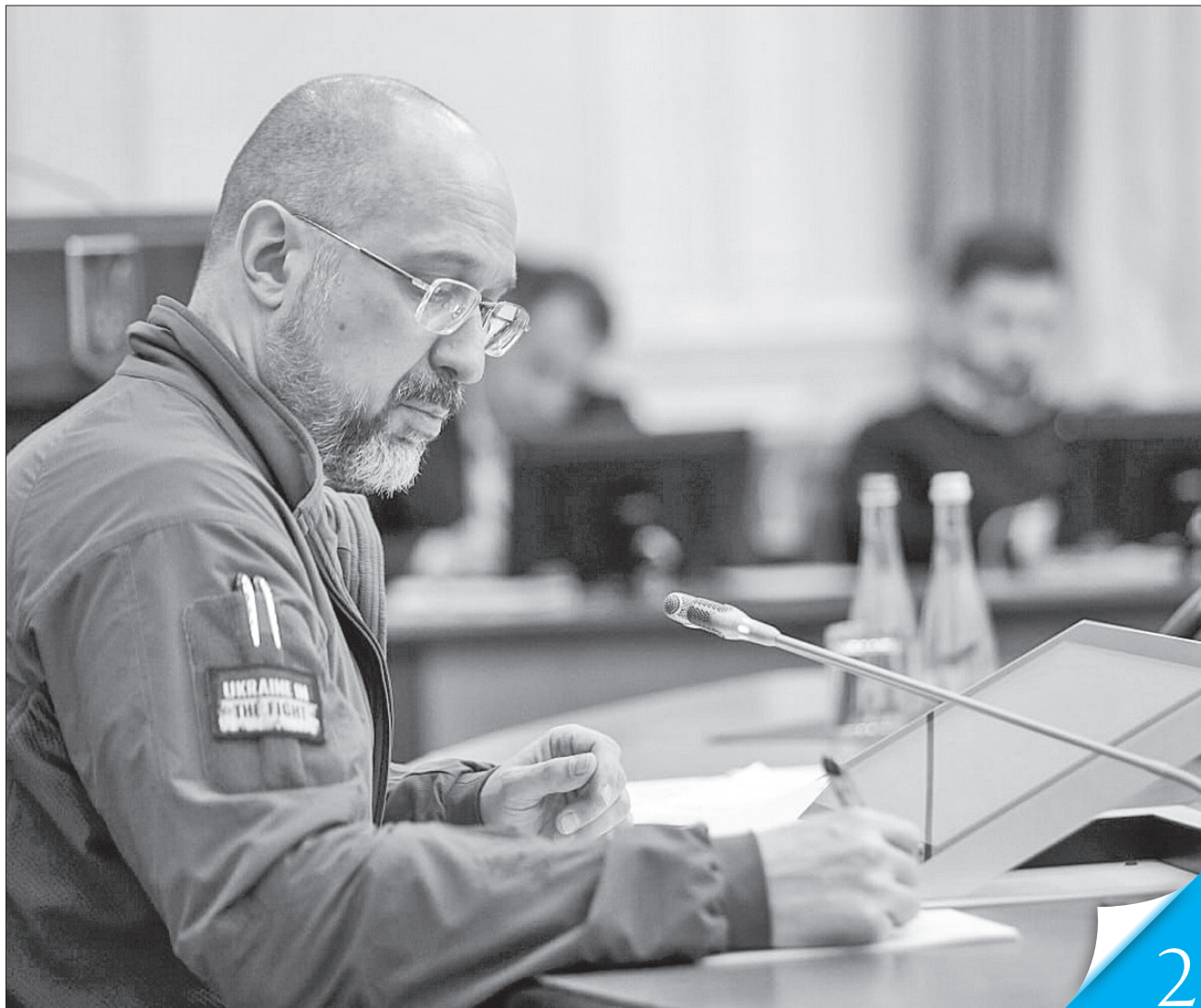
За словами Прем'єра, нині створюють прецедент матеріальної відповідальності агресора за спричинені ним втрати

ЗАСІДАННЯ КАБІНЕТУ МІНІСТРІВ. Учора в Гаазі розпочав роботу Міжнародний реєстр збитків