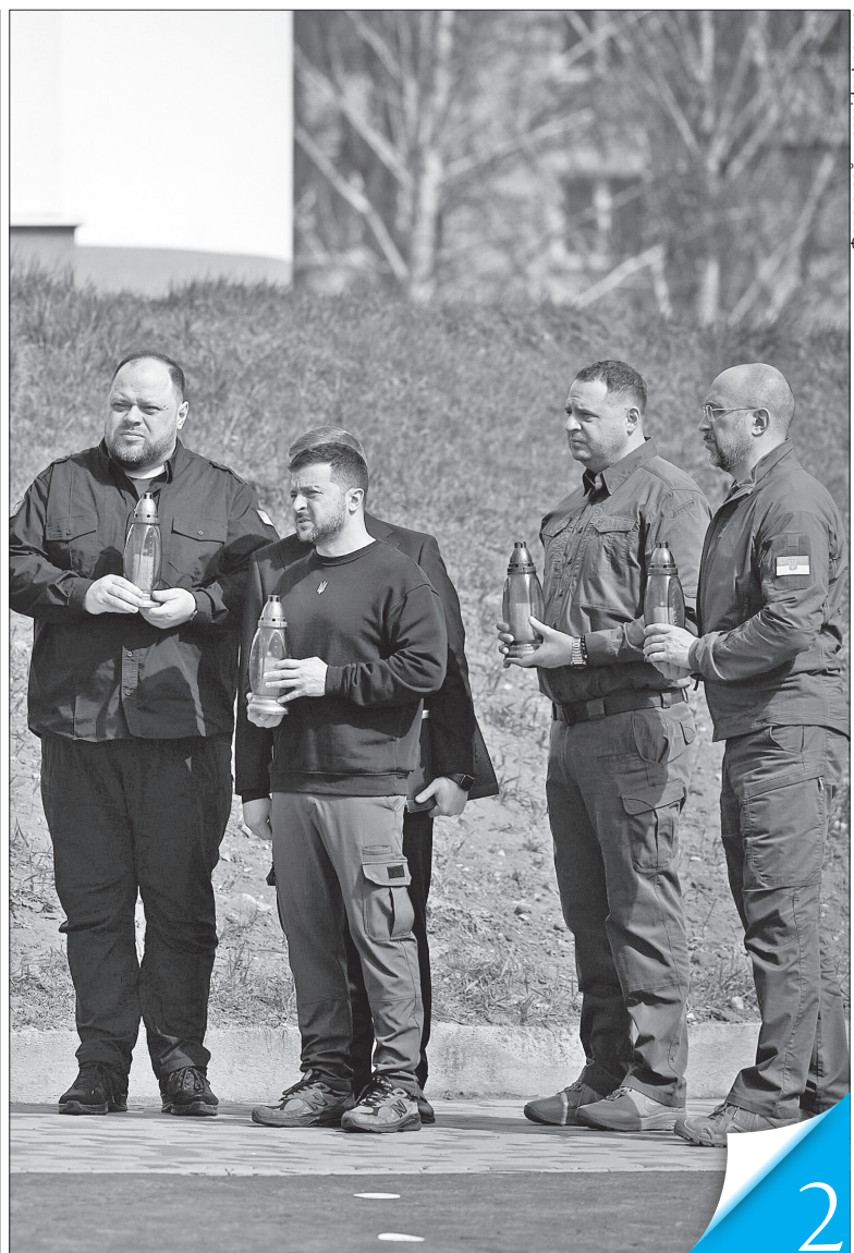
Керівництво держави вшанувало пам'ять українців, яких убили загарбники під час окупації Бучанської громади

БИТВА ЗА РЕГІОН. 2 квітня 2022 року Київщину повністю визволили від російської окупації